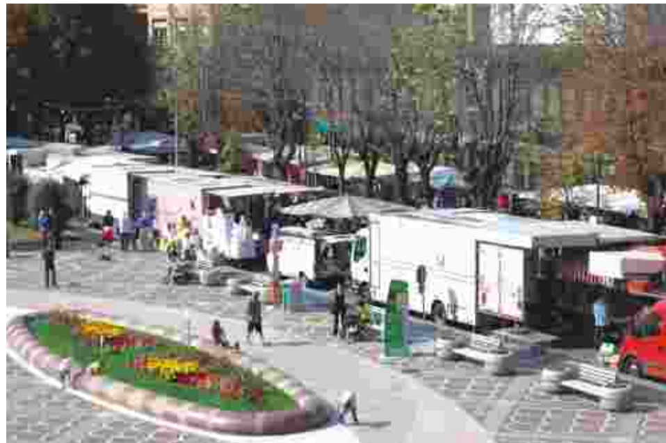
Il mercato del sabato su viale Buridani

Tale ristrutturazione pone però il problema di ricollocare gli ambulanti che attualmente vi operano tre volte a settimana. D'accordo con gli operatori, l'Amministrazione ha in pro-