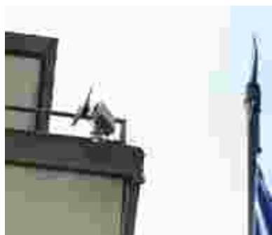
Un'antenna Wi-Fi, con il sistema Mesh

Sarà dunque possibile accedere a internet (gratuitamente per i residenti e per chi vi la-