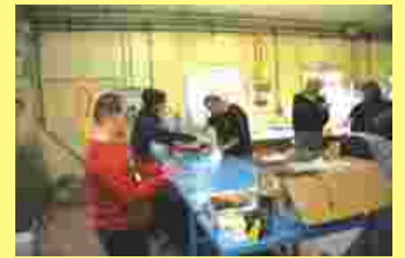
I soci della cooperativa Dalla stessa parte, alle prese con l'assemblaggio delle luminarie

La costruzione ed installazione delle luminarie natalizie sono state per il terzo anno consecutivo affidate alla cooperativa sociale ciriacese Dalla stessa parte. Si tratta di una realtà cooperativistica che dà lavoro a soggetti disabili, svantaggiati e con un difficile, se non impossibile, accesso al mondo del lavoro.