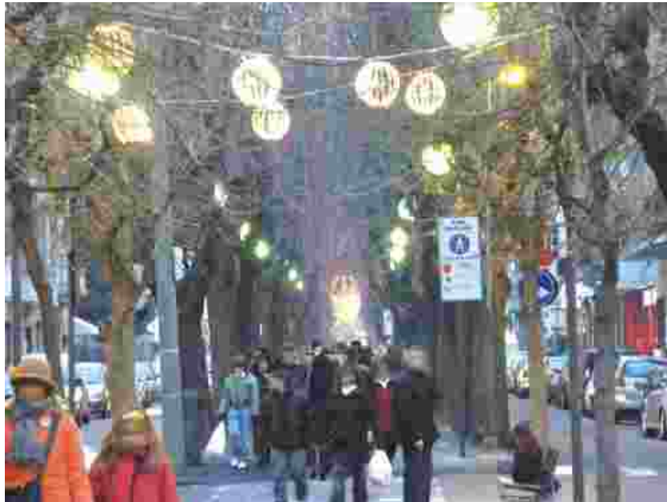
Natale 2008, ultimi acquisti in viale Buridani

L'associazione di via "Viale Buridani É La Reale" propone l'ornamento del viale in corrispondenza degli esercizi degli associati, con conifere ed allestimento alle vetrine di barre led. Sarà inoltre posizionato il consueto tappeto rosso antistante gli esercizi commer-