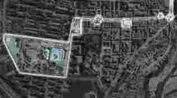
Il progetto d'insieme di riqualificazione delle piazze e degli assi commerciali

Entro il 2009 sarà bandita la gara per la ristrutturazione di piazza De Gasperi. Gli operatori verranno temporaneamente ricollocati sulle vie Leopardi e Generale Dalla Chiesa e viale Buridani