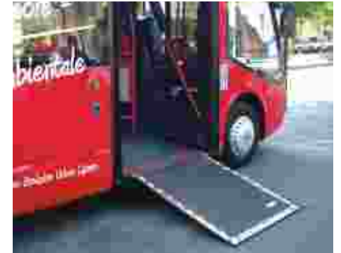
La presentazione della navetta elettrica

avanzata di attuazione, la realizzazione di mezzi elettrici utili anche al trasporto delle merci. Dovranno poi essere reperite altre risorse economiche per portare a termine questo progetto, denominato "ultimo miglio", che riguarda il trasporto ecologicamente sostenibile, ad emissioni zero. Si realizzerebbero dei poli logistici per l'attestamento delle merci che arrivano con veicoli tradizionali, lungo il perimetro della città. I soli veicoli ad impatto ambientale zero, risultato dello sviluppo del progetto di ricerca di cui sopra, potranno effettuare il movimento delle merci nel territorio cittadino. Lo stesso telaio sarà, quindi, "vestito" ora per il trasporto di persone, ora come carro per il trasporto merci (frigo o furgone scoperto con cassone o furgone chiuso). Auspichiamo una condivisione del progetto con altri Comuni della zona, ad esempio Torino e Collegno. Dalla centrale logistica, partiranno quindi i mezzi ad emissione zero, i quali trasporteranno ai commercianti, alle aziende ed industrie cittadine, le materie di consumo per la produzione e vendita legata alla loro attività».