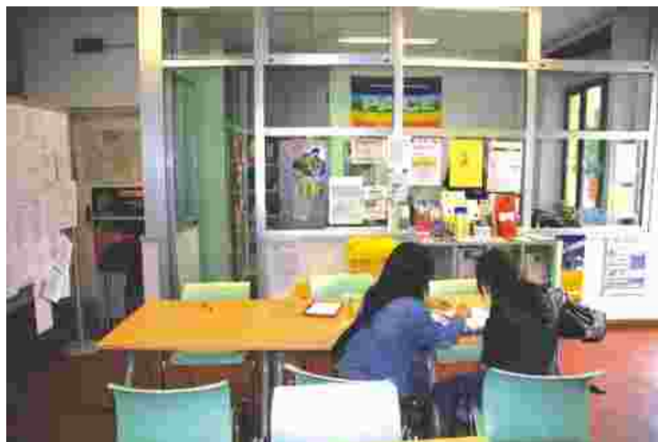
Per informazioni approfondite sulle misure della Città di Venaria Reale e dagli altri enti pubblici, rivolgersi all'ufficio lavoro, in via Goito 4

te a istruzione, salute, lavoro, casa. Da ricordare inoltre che il Cissa, Consorzio intercomunale servizi socio assistenziale, attiva interventi previsti dall'art. 7 della l. r. 35 del 30.12.2008, mirati ad affrontare il disagio sociale